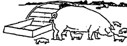
Arbeitsgemeinschaft für artgerechte Nutztierhaltung e. V. Tierschutzfachverband, Hamburg (AGfaN)